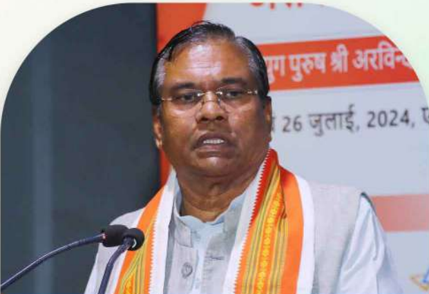
श्री फगुन सिंह कुलस्ते जी निवर्तमान केंद्रीय मंत्री एवं वरिष्ठ सांसद