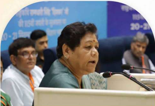
सुश्री अनुसुइया उइके जी महामहिम राज्यपाल, मणिपुर