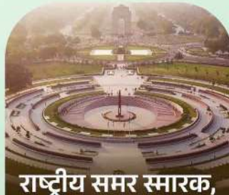
राष्ट्रीय समर स्मारक, इंडिया गेट