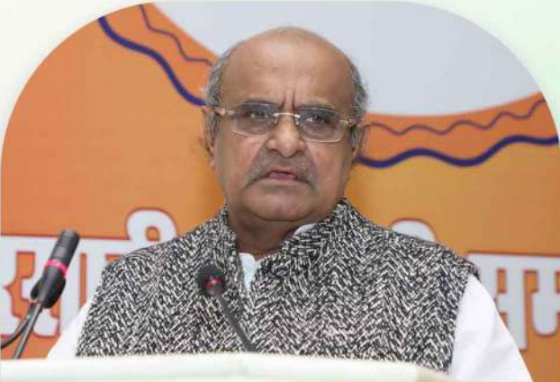
श्री के.सी. त्यागी जी वरिष्ठ नेता, आरएलडी निवर्तमान लोकसभा एवं राज्यसभा सांसद