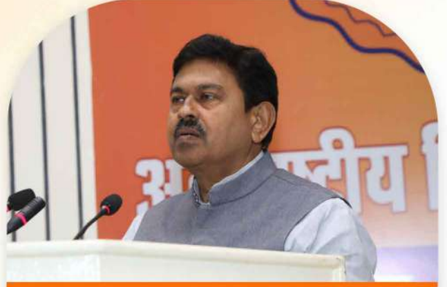
अजय कुमार मिश्रा जी निवर्तमान गृह राज्य मंत्री, भारत सरकार