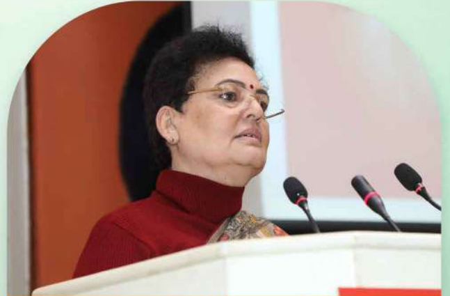
श्रीमती रेखा शर्मा राज्यसभा सांसद निवर्तमान अध्यक्ष, राष्ट्रीय महिला आयोग, भारत सरकार