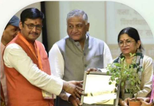
श्री वी.के. सिंह जी माननीय केंद्रीय राज्य मंत्री, भारत सरकार