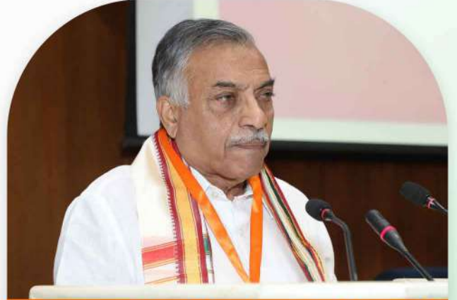
पद्मश्री, पद्मभूषण आचार्य यार्लगड्डा लक्ष्मीप्रसाद जी निवर्तमान सांसद, राज्यसभा राष्ट्रीय अध्यक्ष, विश्व हिन्दी परिषद निवर्तमान उपाध्यक्ष, संसदीय राजभाषा समिति, भारत सरकार