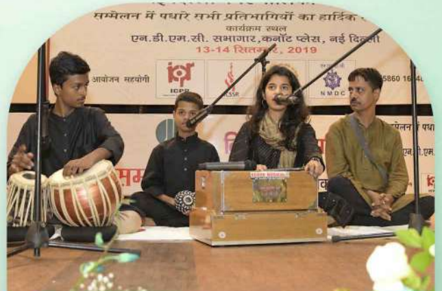
सुश्री मैथिली ठाकुर राष्ट्रीय ख्याति प्राप्त गायिका