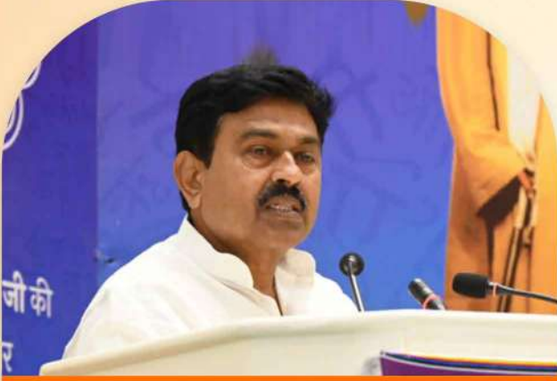
श्री अजय कुमार मिश्र जी निवर्तमान गृह राज्य मंत्री, भारत सरकार