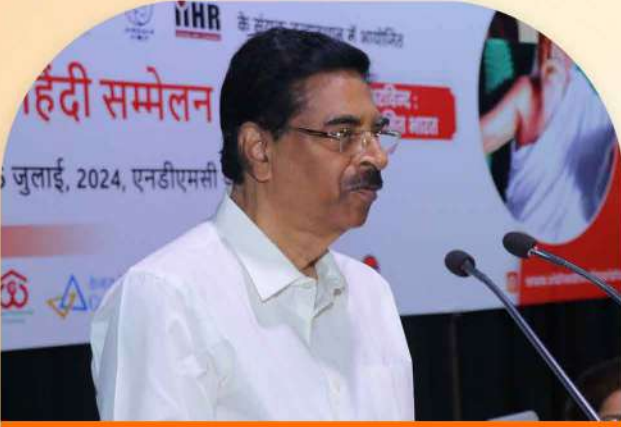
डॉ. हरि बाबू कंभमपति जी महामहिम राज्यपाल, ओडिशा