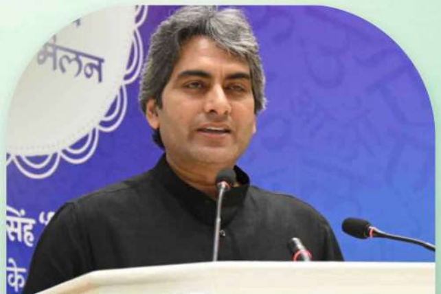
श्री सुधीर चौधरी जी वरिष्ठ पत्रकार, आजतक न्यूज़