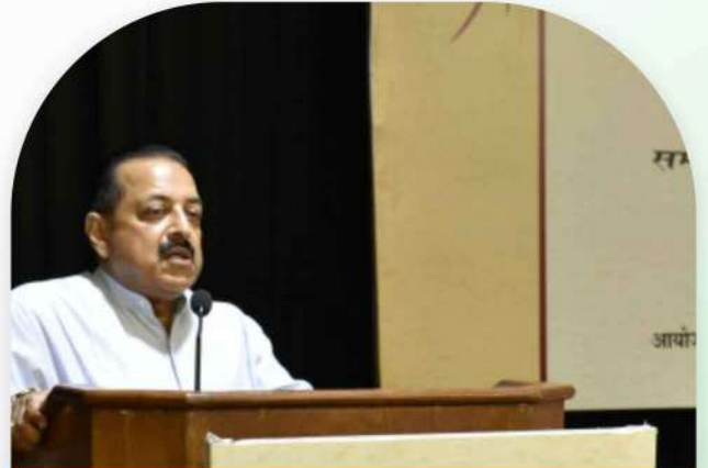
डॉ. जितेंद्र सिंह जी माननीय केंद्रीय राज्य मंत्री, भारत सरकार