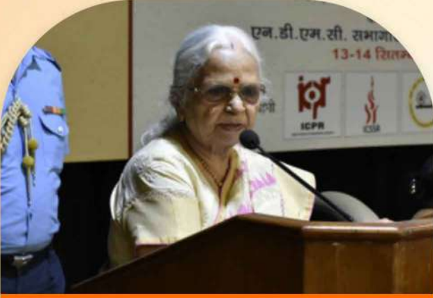
श्रीमती मृदुला सिन्हा जी महामहिम राज्यपाल, गोवा