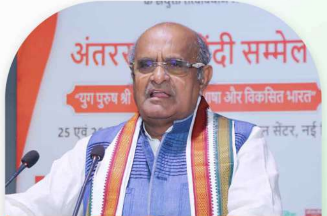
श्री के.सी. त्यागी जी वरिष्ठ नेता, आरएलडी निवर्तमान लोकसभा एवं राज्यसभा सांसद