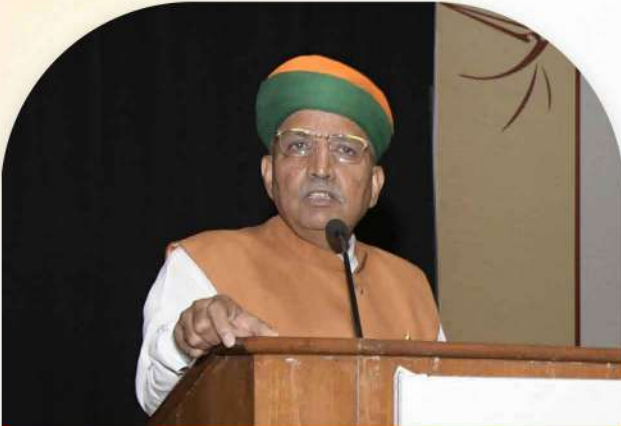
श्री अर्जुन राम मेघवाल जी माननीय केंद्रीय राज्य मंत्री, भारत सरकार