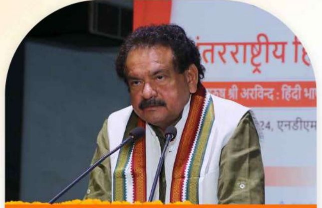
प्रो. एस.पी. सिंह बघेल जी माननीय केंद्रीय राज्य मंत्री, भारत सरकार