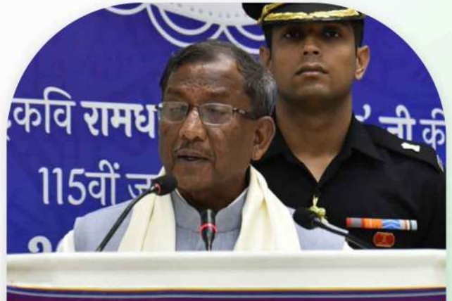
श्री लक्ष्मण प्रसाद आचार्य जी महामहिम राज्यपाल, असम