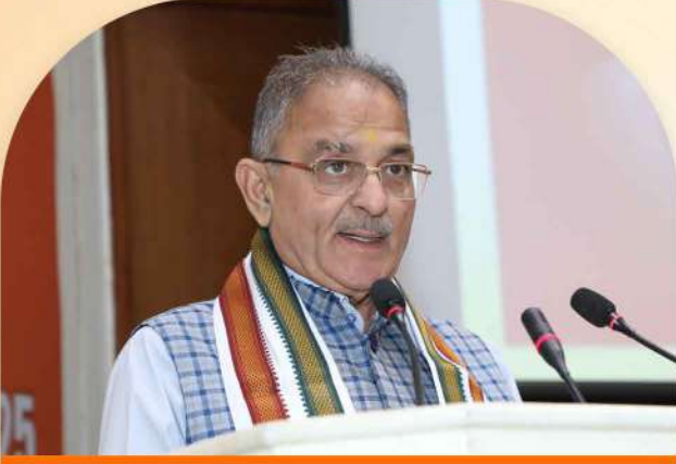
कविंद्र गुप्ता जी माननीय उपराज्यपाल, हिमाचल प्रदेश