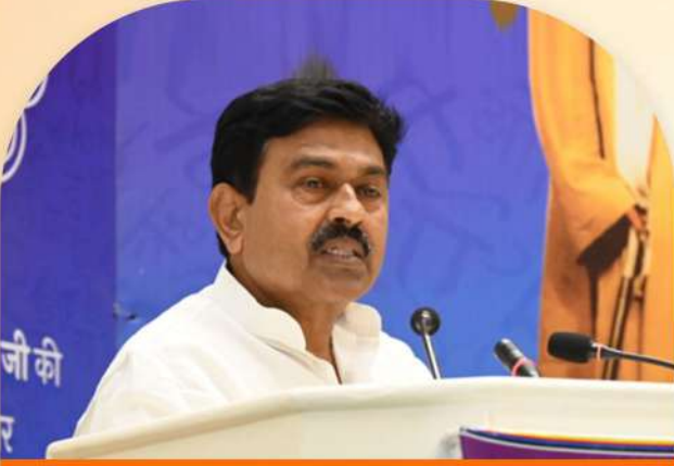
श्री अजय कुमार मिश्र जी माननीय केंद्रीय गृह राज्य मंत्री