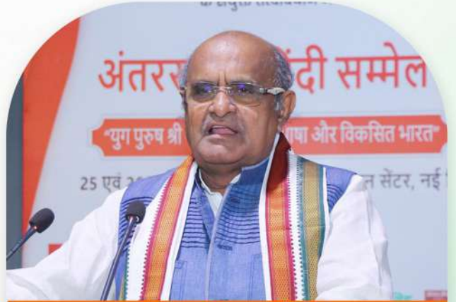
श्री के.सी. त्यागी जी वरिष्ठ नेता, आरएलडी निवर्तमान लोकसभा एवं राज्यसभा सांसद