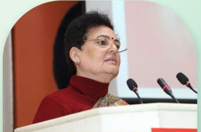
श्रीमती रेखा शर्मा राज्यसभा सांसद निवर्तमान अध्यक्ष, राष्ट्रीय महिला आयोग, भारत सरकार