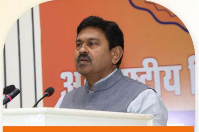
अजय कुमार मिश्रा जी निवर्तमान गृह राज्य मंत्री, भारत सरकार