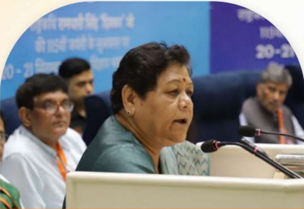
सुश्री अनुसुइया उइके जी महामहिम राज्यपाल, मणिपुर