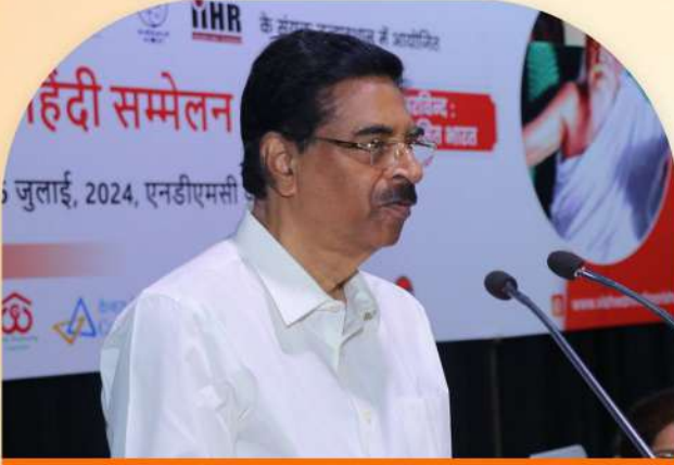
डॉ. हरि बाबू कंभमपति जी महामहिम राज्यपाल, ओडिशा