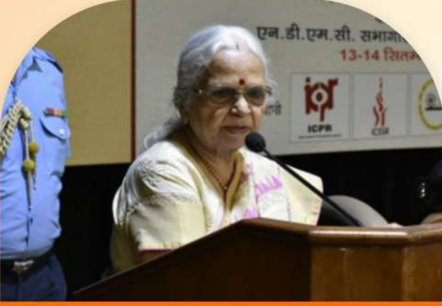
श्रीमती मृदुला सिन्हा जी महामहिम राज्यपाल, गोवा