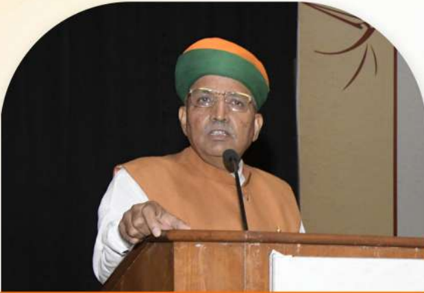
श्री अर्जुन राम मेघवाल जी माननीय केंद्रीय राज्य मंत्री, भारत सरकार