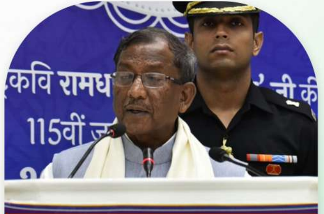
श्री लक्ष्मण प्रसाद आचार्य जी महामहिम राज्यपाल, असम