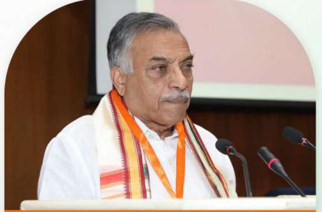
पद्मश्री, पद्मभूषण आचार्य यालगड्डा लक्ष्मीप्रसाद जी निवर्तमान सांसद, राज्यसभा राष्ट्रीय अध्यक्ष, विश्व हिन्दी परिषद निवर्तमान उपाध्यक्ष, संसदीय राजभाषा समिति, भारत सरकार