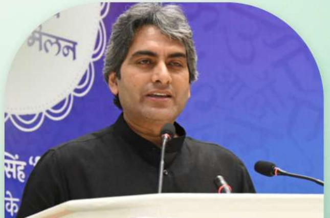
श्री सुधीर चौधरी जी वरिष्ठ पत्रकार, आजतक न्यूज़