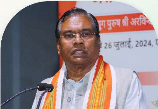
श्री फगुन सिंह कुलस्ते जी निवर्तमान केंद्रीय मंत्री एवं वरिष्ठ सांसद