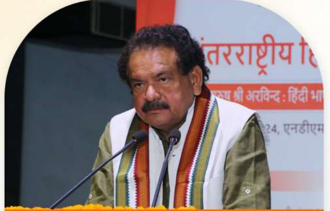
प्रो. एस.पी. सिंह बघेल जी माननीय केंद्रीय राज्य मंत्री, भारत सरकार