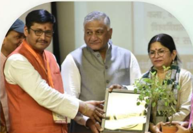
श्री वी.के. सिंह जी माननीय केंद्रीय राज्य मंत्री, भारत सरकार