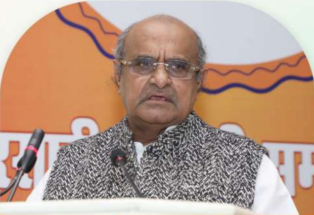
श्री के.सी. त्यागी जी वरिष्ठ नेता, आरएलडी निवर्तमान लोकसभा एवं राज्यसभा सांसद