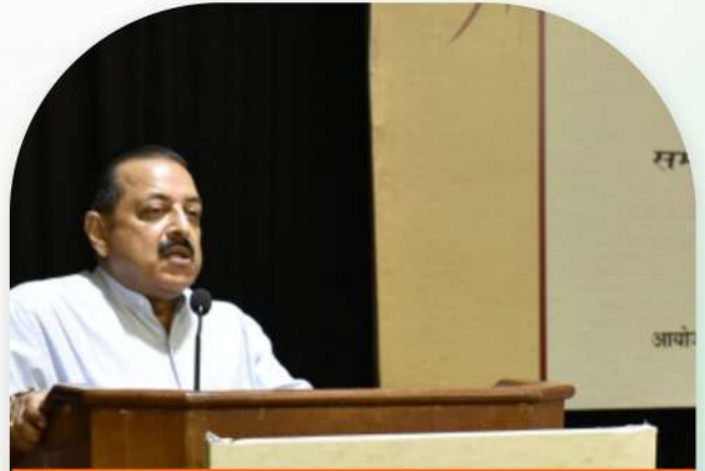
डॉ. जितेंद्र सिंह जी माननीय केंद्रीय राज्य मंत्री, भारत सरकार