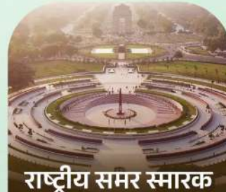
राष्ट्रीय समर स्मारक इंडिया गेट