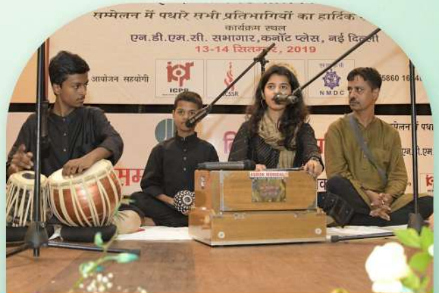
सुश्री मैथिली ठाकुर राष्ट्रीय ख्याति प्राप्त गायिका